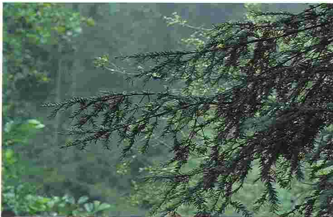
Porsuk ağacının sürgünleri.

ile çapı 3.34 m ve boyu 13 m olan Ulcombe Kilisesi Porsuğu (Kent) bu ülkede bulunmaktadır. Uzun bir ömre sahip olan porsuklar yavaş büyürler, 2000-3000