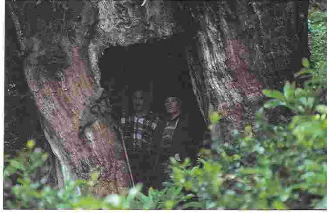
Anıt Taxus baccata L'nin gövdesindeki sığınak.

ereği öz odunu geniş yapıdadır. Odunu mobilya ve oymacılıkta kullanılan porsuğun dayanıklı ve elastik olan kalın sürgünleri de yay yapımında çok eski çağlardan beri kullanılmaktadır. Gordion'daki Frigya Kralı Midas'ın mezarındaki porsuk odunundan yapılmış mobilya parçaları bunu kanıtlamaktadır. İngilizlerin halk kahramanı Robin Hood yayını porsuktan yaptığı için, mistik ve folklorik açıdan İngiltere'de bu ağaca büyük önem verilmektedir. Avrupa'nın en geniş çaplı porsuk ağaçları - çevresi 15.8 m, boyu 13 m olan Fortingall Porsuğu (Perthshire)