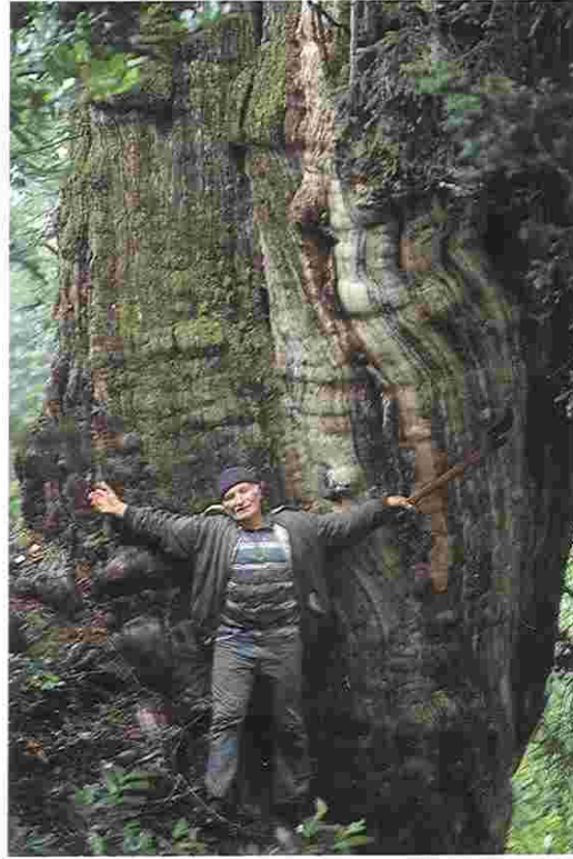
Anıt Taxus baccata L'nin gövdesi.

P orsuk ağacı, 20-25 m kadar boylanabilen 1-3 m arasında gövde genişliği (çap) yapan, gövde kabuğu kırmızı - kahverengi ve ince pullar halinde soyulan bir ağaçtır. Her dem yeşil, uçları sivri şeritsi yapraklar uzun sürgünlere, sarmal olarak dizilmiştir. Genellikle yaprakların ışığa yönelmesinden dolayı taraksı bir görünüm sergiler. Yaprakların üst yüzeyi koyu yeşil, alt yüzeyi ise açık yeşildir. Yaprak alt yüzeyindeki stoma (gözenek) bantları belirgin değildir. Yapraklarında reçine kanalları bulunmaz. Porsuklar çiçek yapısı bakımından bir cinsli, iki evcikli yani erkek ve dişi çiçekler ayrı ayrı ağaçlarda bulunurlar. Tohumlu bitkilerin, açık tohumlular alt bölümünün, kozalaklılar sınıfına dahil olan porsuklar, dişi çiçekleri döllendikten sonra bir yılda olgunlaşan tohumun yarısından fazlasını saran etli yapıda ve olgunlaştığında kırmızı renk alan yalancı kozalak ile kapçık (arillus) oluştururlar.